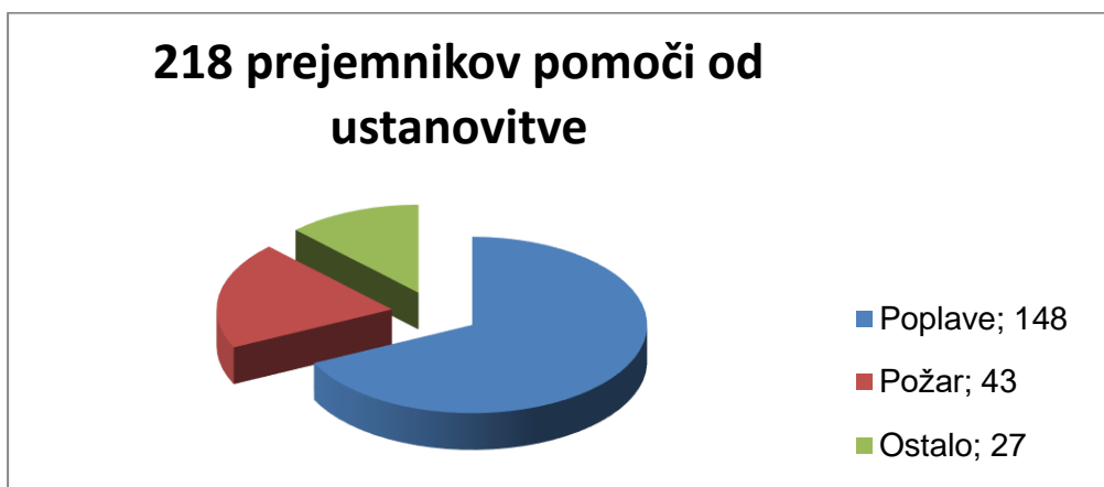
Tabela 2: Število prejemnikov pomoči od ustanovitve Ustanove – prva pomoč je bila nakazana aprila 2010 ob požaru gostilne

Od ustanovitve dalje je Ustanova pomagala 218 oškodovancem. Od tega je bilo 148 oškodovancev zaradi poplav, 43 oškodovancev zaradi požara in 27 drugih prejemnikov pomoči.